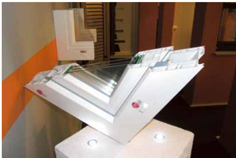
Slika 4 To PVC okno ima tri brezkonzna tesnila. Odlično tesni, zato je potrebno zrak dovajati v prostor drugače, z mehansko prezračevalno napravo ali pa spremeniti bivalne navade. Kako pravilno zračiti, če ni prisilnega prezračevanja: v enakomernih časovnih intervalih (npr. vsake 3 h) zaprite radiatorje, počakajte 0,5 h da se ohladijo, odprite za kratek čas (5 - 10 min) okna na stežaj tako, da se ves zrak v prostorih zamenja, toplota pa ostane v stenah, nato zaprite okna in odprite radiatorje. In tako petkrat dnevno, vsak dan, vso kurilno sezono

dovolj prezračevana, saj naravno prezračevanje ne zadošča, stanovalci pa niso spremenili bivalnih navad niti vgradili mehanskih prezračevalnih naprav.