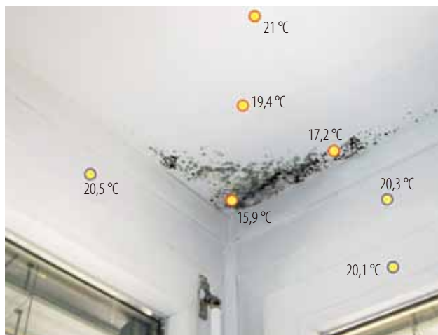
Slika 3 Namesto termovizijskega pregleda lahko ugotovimo nevarnost kondenzacije že z IR termometrom. Vzrok ohlavitve in poškodb: toplotni most zaradi napake v gradnji

Kakovost notranjega zraka je deloma poslabšana zaradi obsežnih kampanj za varčevanje z energijo. Poleg tega stanovalci zaradi visokih cen energije nižajo stroške tudi z zmanjšanjem prezračevanja, marsikatero stanovanje je zaradi tega izjemno slabo prezračevano. Na slabo kakovost zraka vplivajo tudi novi materiali, predvsem polimeri in številne elektronske naprave, ki so vgrajene v zaprtih prostorih, v otroških sobah, spalnicah, bivalnih prostorih itd. Povečanje zahtev po energijski učinkovitosti vse pogosteje vpliva na tesnjenje stavb. Taka stanovanja niso